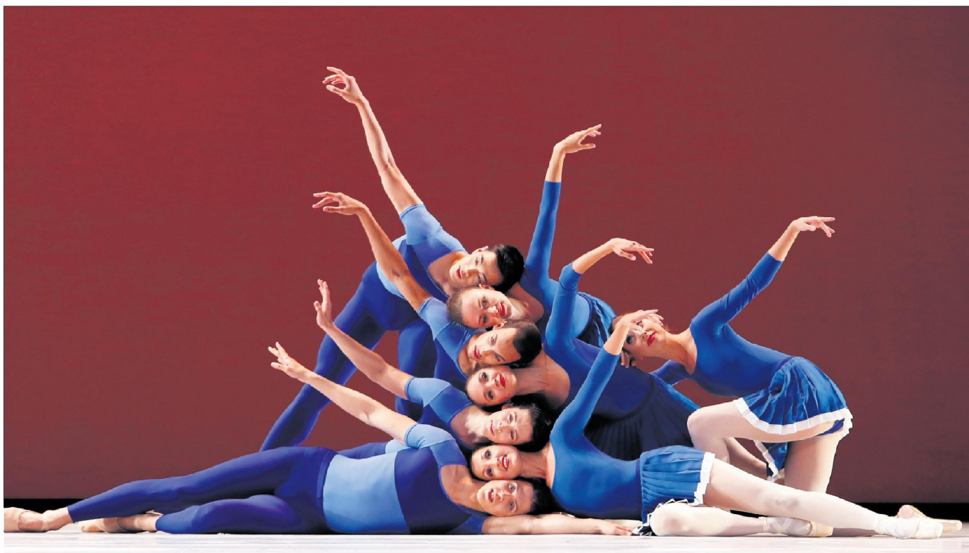
Het Nationale Ballet in 'Year of the rabbit' van Justin Peck.